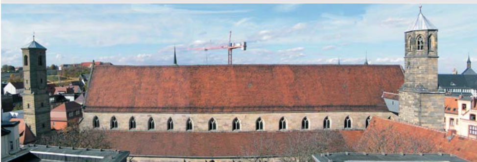
Obergaden des Kirchenschiffes von Süden, zwischen Paulsturm und Turm der Predigerkirche

Auf den ersten Blick erscheinen die Vorher -Nachher-Aufnahmen keine größeren Unterschiede aufzuweisen. Erst bei näherem Hinsehen ist zu erkennen, wie die Sandsteinfassade behutsam und unter Rücksichtnahme auf den Bestand restauriert und konserviert wurde. Alterungsspuren blieben dabei erhalten