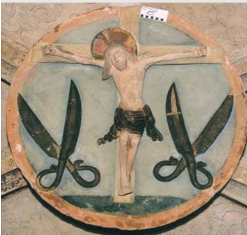
Schlussstein, gestiftet von der Schneiderzunft

Die Deckenfassung wurde nach Befundlage gereinigt und restauratorisch überarbeitet.