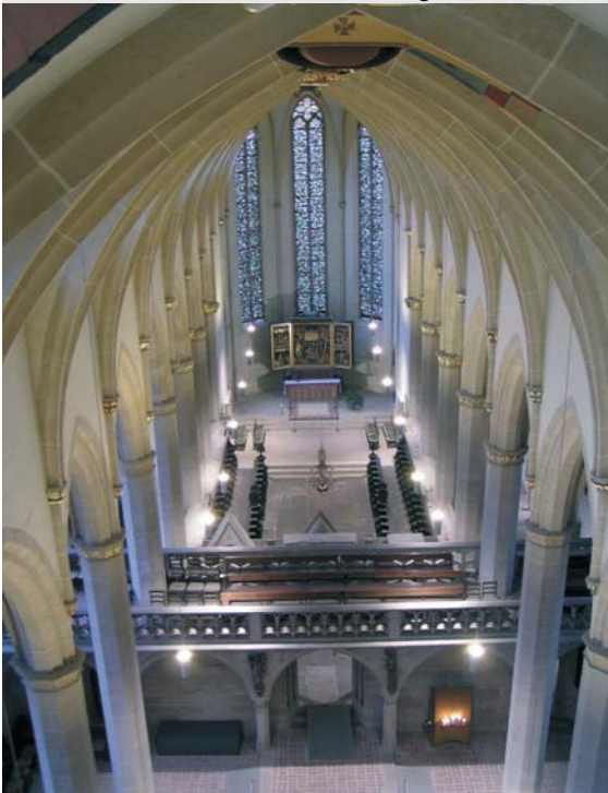
Blick über den Lettner zum Chor

gefördert durch die Beauftragte der Bundesregierung für Kultur und Medien